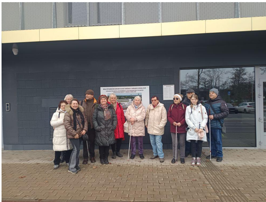
Exkurze malšovický stadion HK