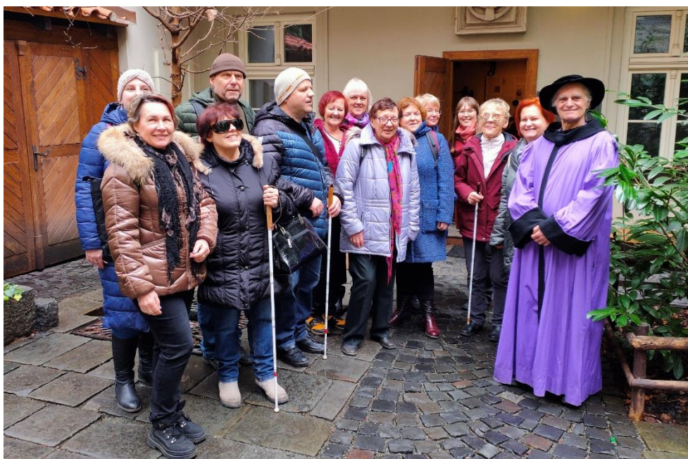
Muzeum alchymistů a mágů