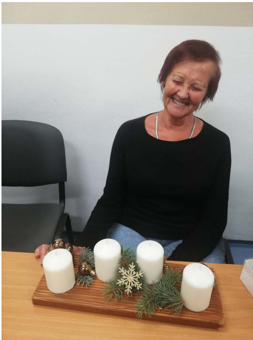
Adventní tvoření netradičních věnců

předcházet. Společně tedy budeme v průběhu zimních měsíců trénovat náš organismus a zajdeme si na relax do prostor solné jeskyně v Třebši. Cena za vstup je pro ZTP pro každého 120 Kč/hod. S sebou náhradní ponožky světlé barvy.