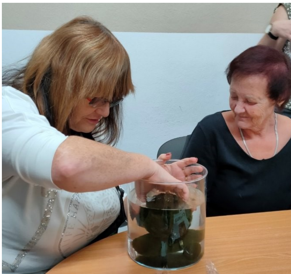
Přednáška - řasokoule