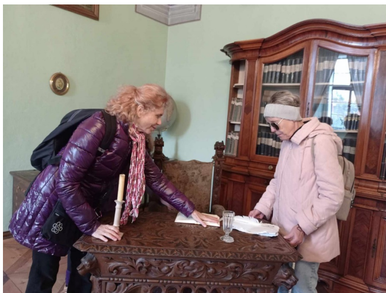
Klášter v Polici nad Metují