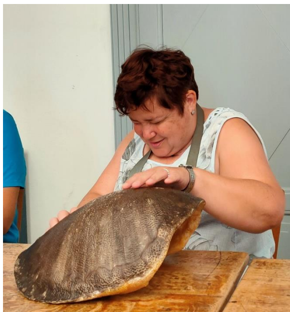
Přednáška Doteky Afriky

Pondělí až pátek 9-13 hodin (nutná telefonická domluva)