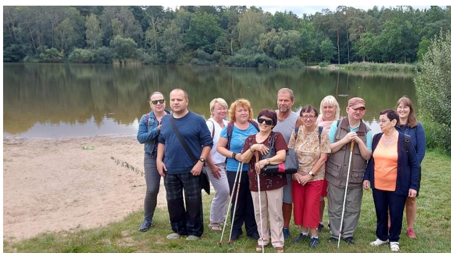
Procházka k Biříčce